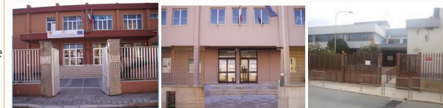
Plesso "G. B. Quinci", Via Belli, n. 1, Scuola Primaria.